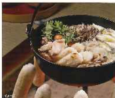
【秋田県/宮内町産】きりたんぼセット(大人用).....2,625円

秋田の名産「きりたんぼセット」や「稲庭手延うどん」をはじめ、秋田県を中心とする東北の美味しいものを取り揃えております。この機会に、ぜひみちのくの味をお楽しみください。