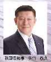
秋田県知事 井竹 敏久

「京急あきたフェア」は、秋田県、京急電鉄、JA全農あきたとの共同で開催させていただいており、今年で3回目となります。秋田の魅力をもっと皆様にお届けしますので、この機会に、秋田の「美味しいもの」「いいもの」「いいところ」に触れて、体感してください。秋もまた魅力いっぱい秋田へ、そして東北へ、皆様、ぜひお越しください。