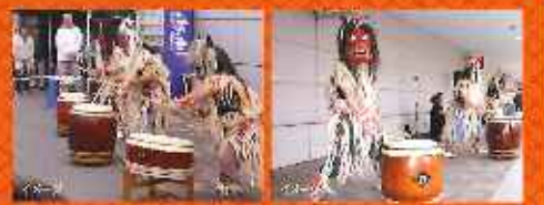
※写真は2010年の撮影ものです。

京急あきたフェア2011開催記念!! 京急オリジナル米袋入り 秋田県産あきたこまち