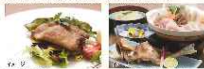
【イタリア】 北内産鶏のグリルイタリアーノ