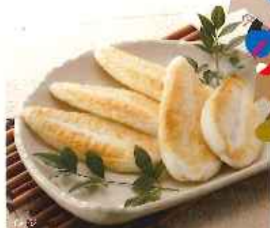
【高城町/松浦町産】ゆきかき餅(中)第百周年.....158円